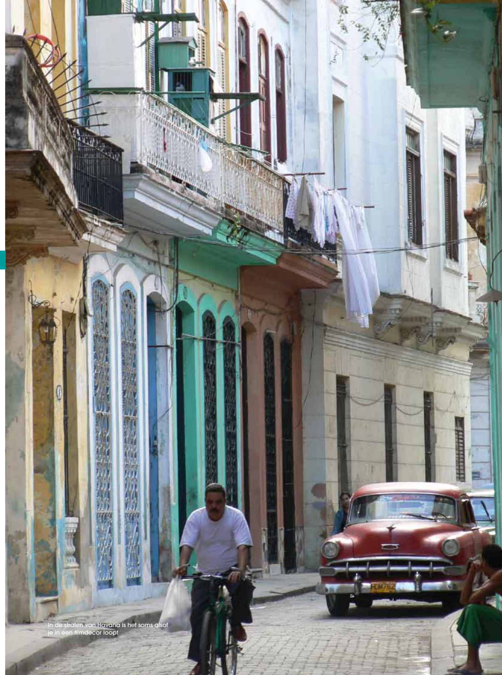
In de straten van Havana is het soms alsof je in een flimdecor loopt

Verdiept in een boek over Fidel toast ik in het drukke 'Bodeguita del Medio' op voormalig stamgast Ernest Hemingway. De zeewind lokt mij weer naar buiten, →